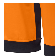
Bord côtes renforcés