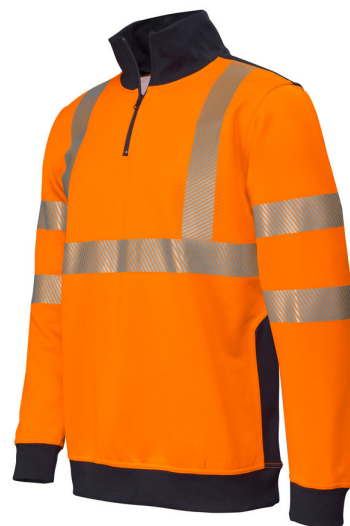
Sweat-shirt HV Bicolore col montant zippé / Orange