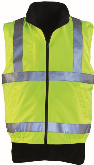
Jaune / Noir