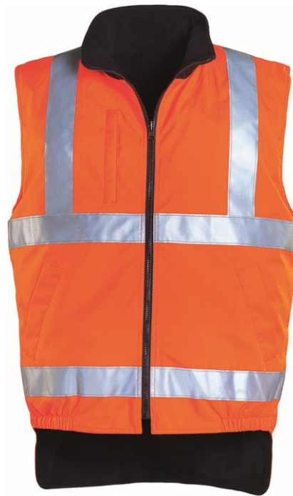
Orange / Noir